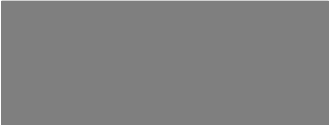
Tabula 4. Komersanti, kuri guva ieņēmumus no savienojumu pabeigšanas pakalpojumu sniegšanas fiksētajā tīklā 2019.gadā