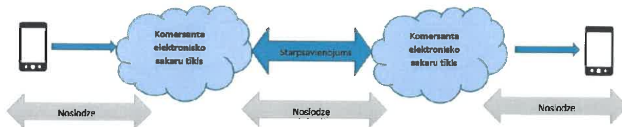
Attēls 1. Savienojumu pabeigšanas pakalpojums